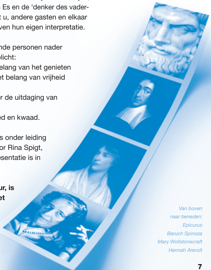
Van boven naar beneden: Epicurus Baruch Spinoza Mary Wollstonecraft Hannah Arendt

Kijk voor een routebeschrijving en parkeerinstructies op www.dezwijger.nl .