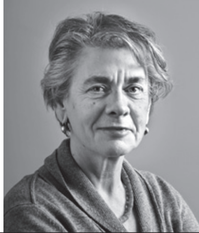
Redactioneel door Ineke de Vries, directeur landelijk bureau

Het congres van de International Humanist and Ethical Union vond dit jaar plaats in Oslo, drie weken na de gewelddadige aanslagen. Het Oslo Congrescentrum staat midden in het gebied waar de bom is ontploft. Delen van de omliggende straten zijn afgesloten met hekken waaraan steeds weer verse bloemen worden gehangen. Het land is in rouw, op straat en op het congres.